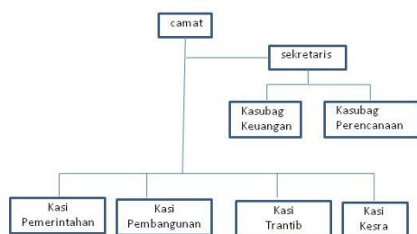
Gambar 4.1. Struktur Organisasi

Adalah gambaran tentang hubungan kerja dalam rangka mencapai tujuan bersama yaitu dengan cara menetapkan hubungan antara pegawai yang melaksanakan tugasnya, pembagian fungsi-fungsi dan wewenang serta tanggung jawab dalam hubungan kerjasama antar satu dengan lainnya.