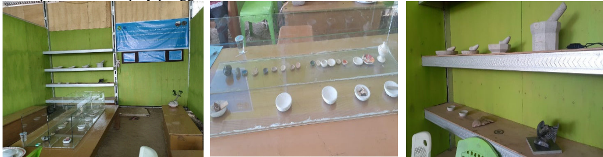
Gambar 3. Suasana dalam Galeri

Ruang seluas 6 m x 15 m disekat dalam dua ruang. 1 ruang berukuran 4m x 15 m ruang pameran produk yang terdiri meja pameran, etalase pameran, etalase display, poster. Dipamerkan segala jenis produk kerajinan batu yang dikerjakan oleh perajin setempat serta cinderamata berdimensi cobekan (gantungan kunci) baik yang dipamerkan maupun yang untuk dijual sebagai cinderamata. Sedangkan ruang seluas 2 m x 15 meter sebelahnya ditempatkan mesin bubut bantuan program PPDM Tahun pertama sebagai tempat produksi sekaligus display pembuatan produk dan display penggunaan alat.