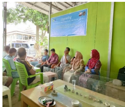
Gambar 2. Sambutan Kepala Desa

Kegiatan selanjutnya adalah pendirian Galeri Seni dan Ruang Pameran Produk diberi nama “Galeri Batu Tulen” yang menjadi salah satu tempat kunjungan wisatawan selain memenuhi maksud orang datang membeli kebutuhan peralatan berbahan batu sebagaimana yang dikenal selama ini sebagai daerah perajin cobekan, lesung, batu nisan dan sebagainya.