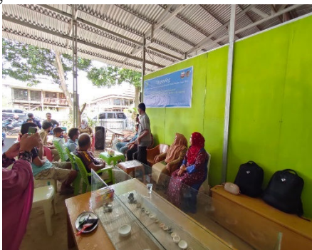
Gambar 1. Upgrading Pemerintahan Dusun dan Desa

Para peserta upgrading merasakan kegiatan ini bermanfaat bagi terbukanya wawasan yang mempunyai dampak bagi pengembangan usaha baik di bidang kerajinan yang sudah menjadi kegiatan khas masyarakat Allakuang juga bagi terbukanya usaha baru atau terbukanya kegairahan berusaha jika desa wisata berhasil diwujudkan. Hal ini merupakan penerapan Metode Penguatan Pola Pikir sekaligus Metode Pembimbingan dan Pendampingan.